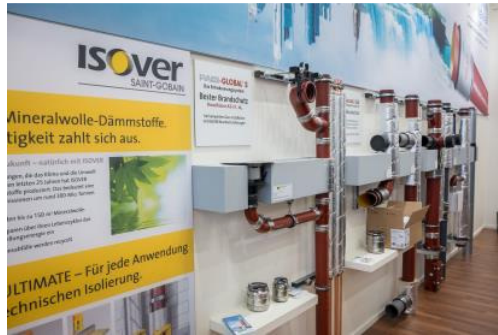
Bild 2: Die neue geprüfte Systemlösung von ISOVER und HES für den vorbeugenden Brandschutz bei Abwasser-Mischinstallationen.